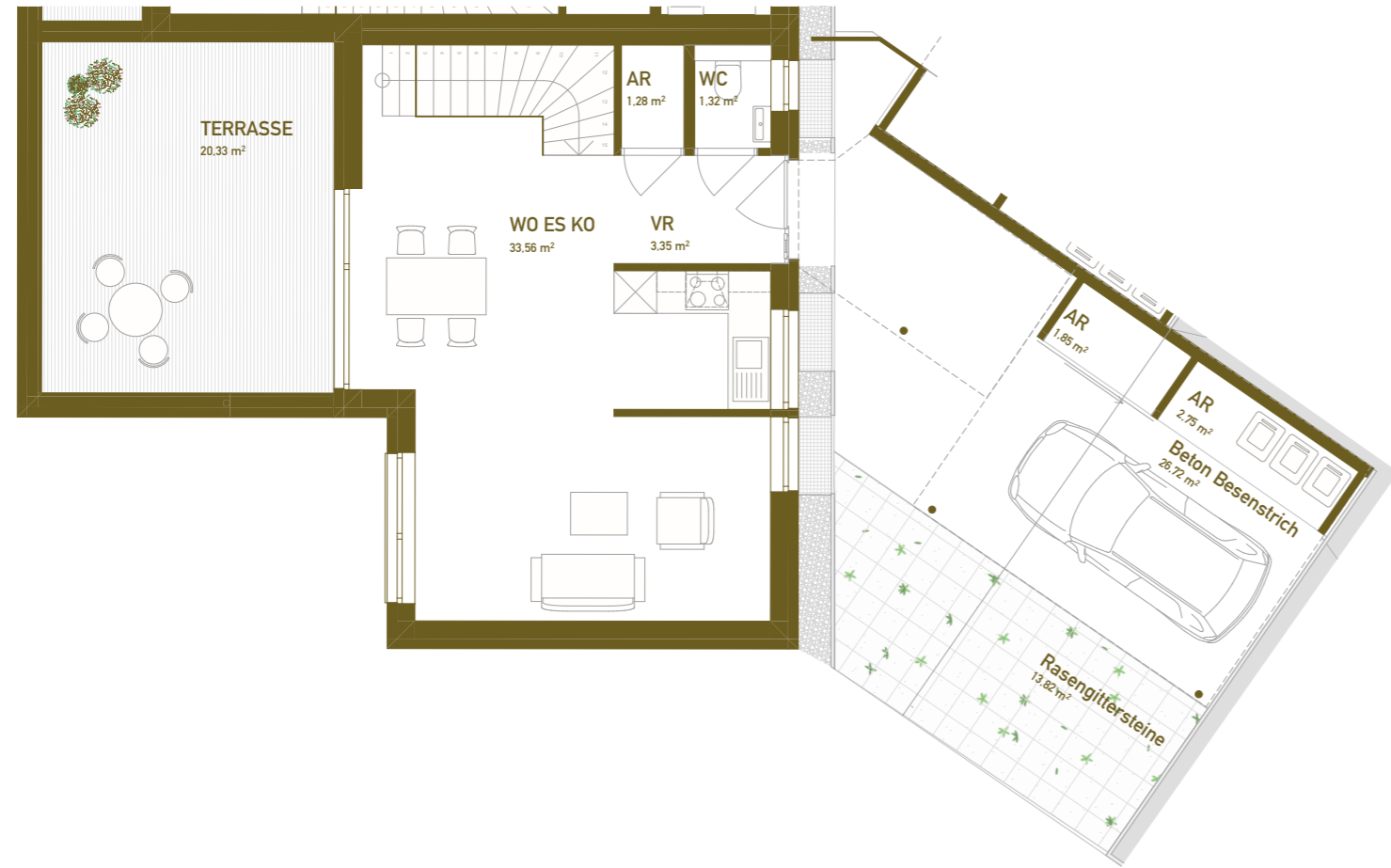
GRUNDRISS EBENE 00