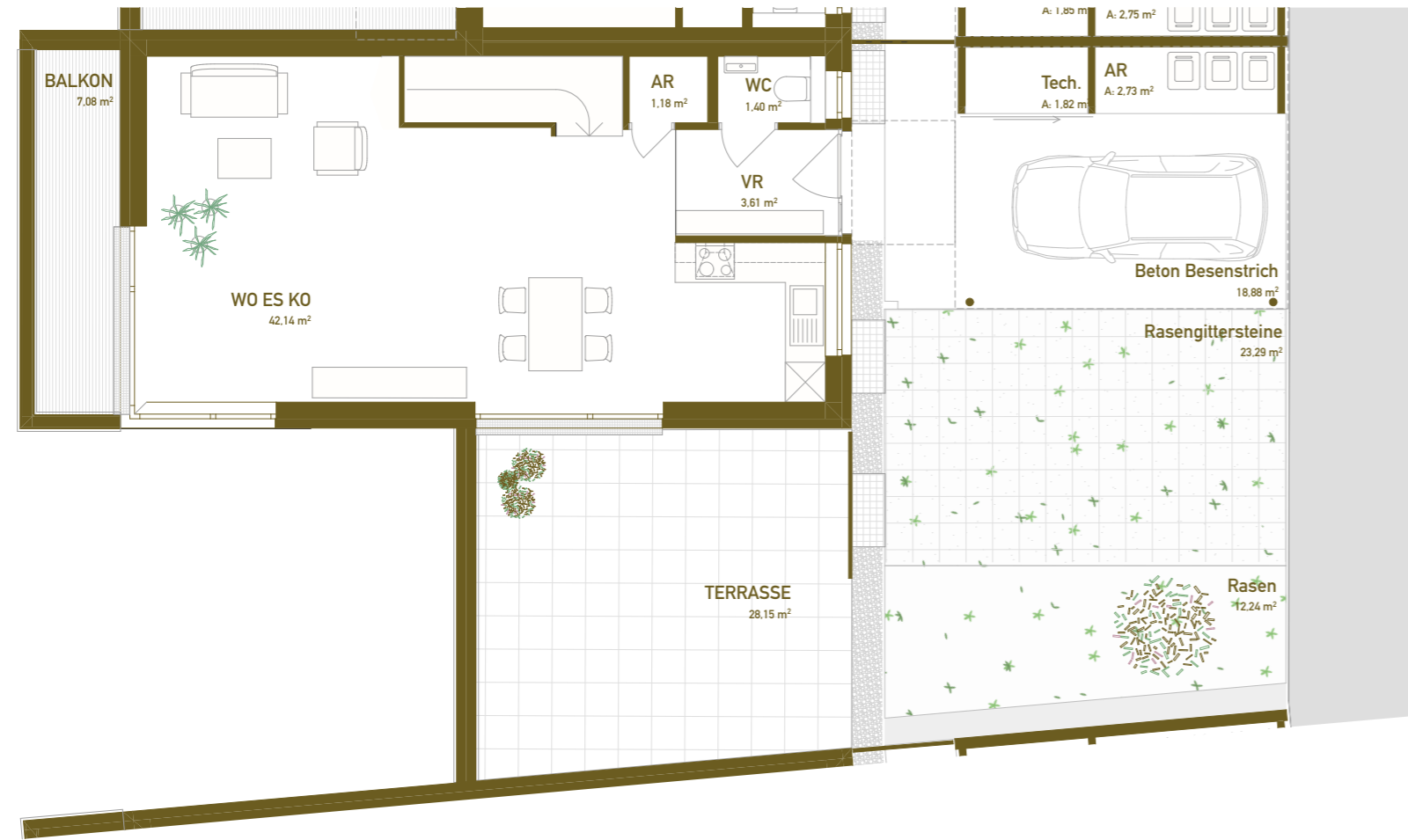
GRUNDRISS EBENE 00